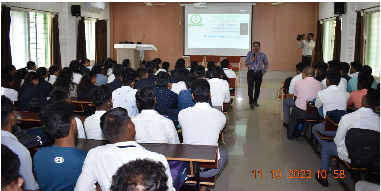
Interactive Session with the students